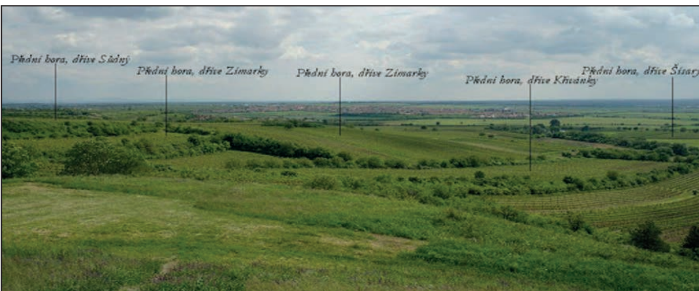
Historické viniční tratě - dnes Přední hora