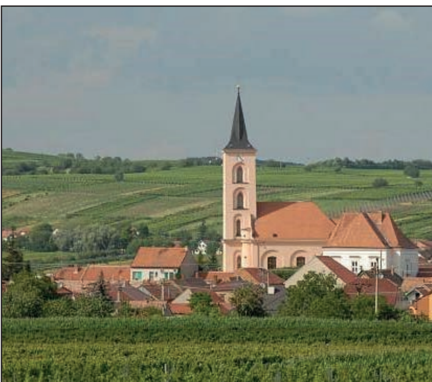
Pohled na bílovické vinice