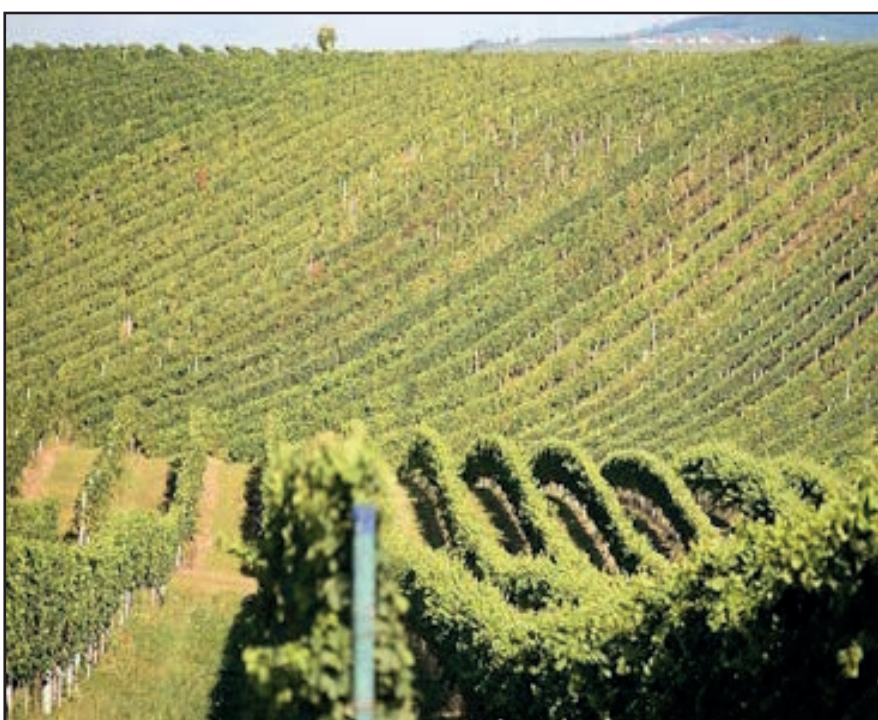
Šísary – pohled na bílovické vinice