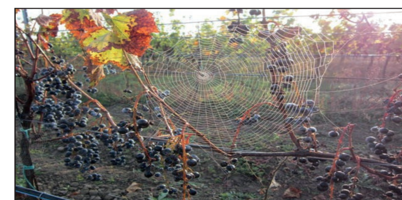
Podzim ve vinici (Velkobílčicko)