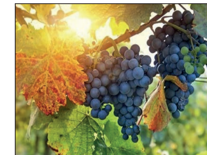
Zrající hrozny (Znojemsko)