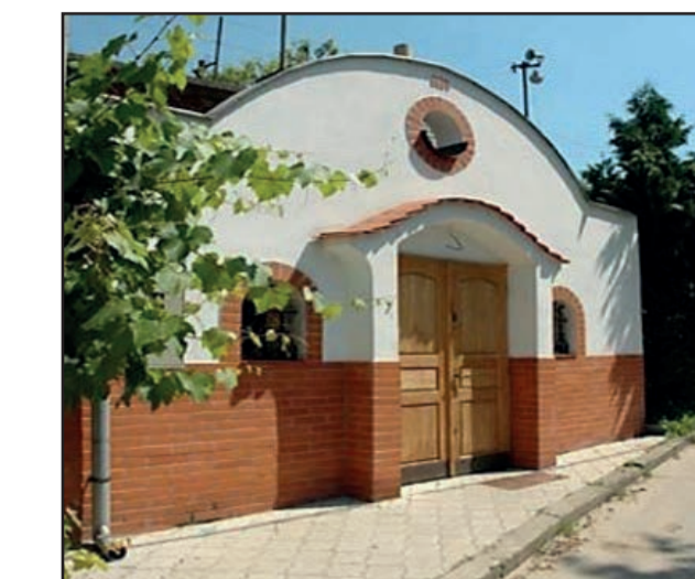
Sklepní stavby (Bzenecko)