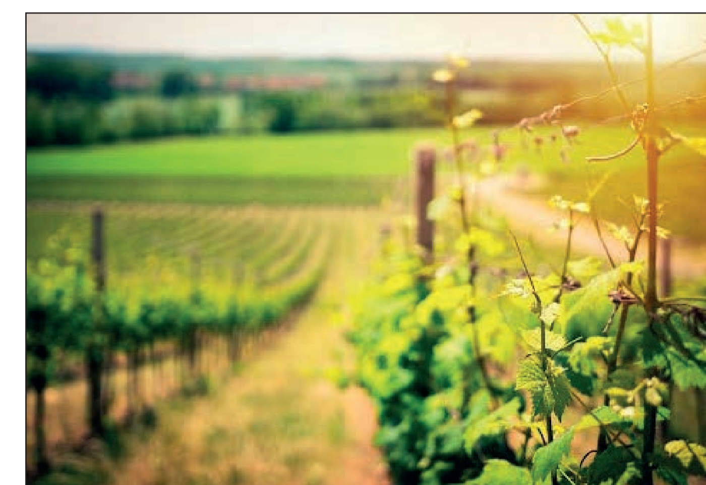
Začátek léta ve vinici (Valticko)